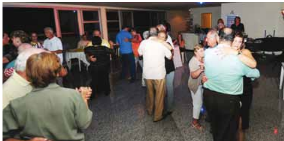
Aposentados dançam e participam de concurso no Baile da Colônia de Férias

A Colônia de Férias do Sindicato na Praia Grande promoveu de 9 a 18 de abril a 1ª Temporada dos Aposentados de 2010. Nestes 10 dias, 180 aposentados da categoria comerciária e seus familiares participaram das atividades especiais da Colônia.