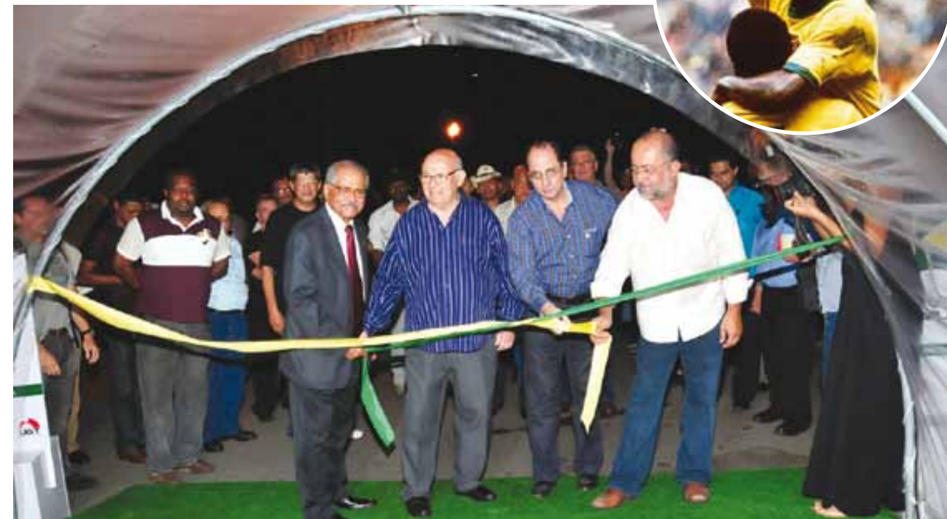
Presidentes das centrais e o ex-jogador Pepe (ao centro, ao lado de Patah) abrem exposição; no alto, Pelé comemora gol na Copa de 70

Pelé - As imagens foram montadas numa tenda em formato de bola de futebol. Nos painéis estavam reproduzidas fotos do jornal e capas da época das copas